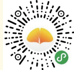
扫描小程序码 体验线上服务

上海佰仁健康产业有限公司 Shanghai Brightown Health Industry Co.,Ltd.